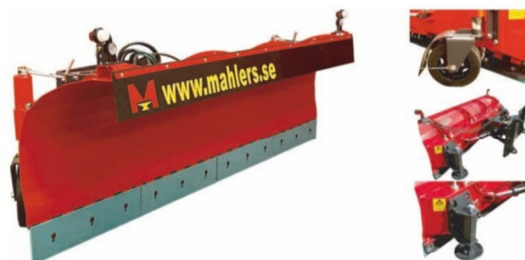
Ett urval av Mählers produkter